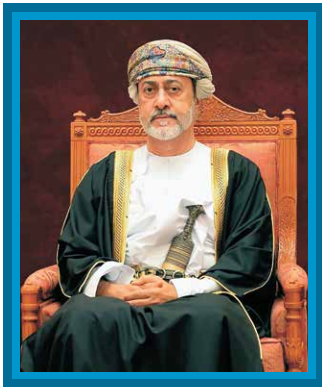
حضرة صاحب الجلالة السلطان هيثم بن طارق المعظم His Majesty Sultan Haitham bin Tariq